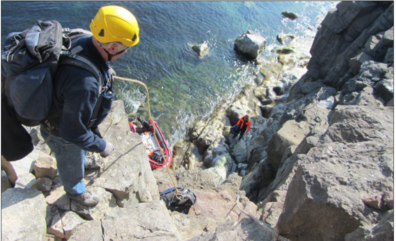
Hér á síðunni er auglýst útboð á leigu á skipi til að þjónusta vita nú í sumar. Myndin er tekin við Bríkurvita 25. júní 2013.