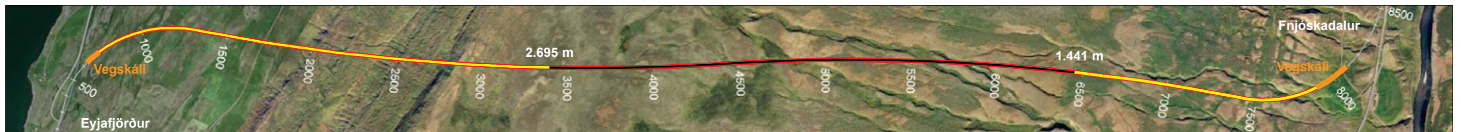
Vaðlaheiðargöng, staða framkvæmda 13. apríl 2015. Búið er að sprengja samtals 4.136 m sem er 57,4% af heildarlengd.