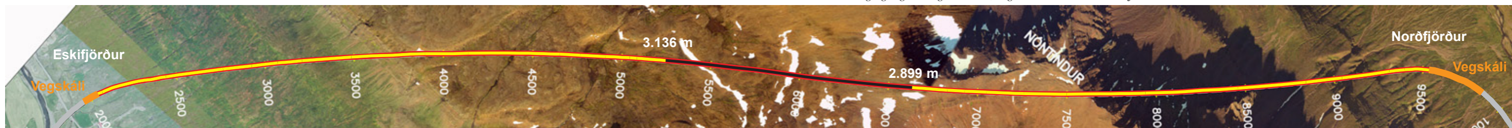
Norðfjarðargöng, staða framkvæmda 11. apríl 2015. Búið er að sprengja samtals 6.035 m sem er 79,7% af heildarlengd.